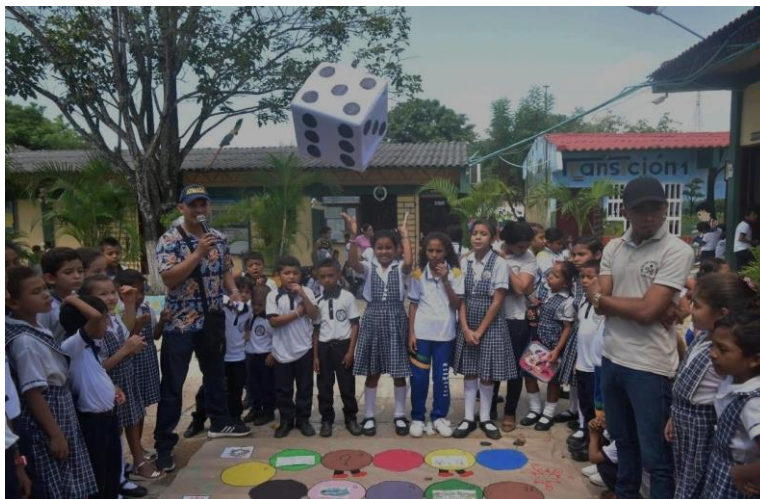
Actividades con grupos de población