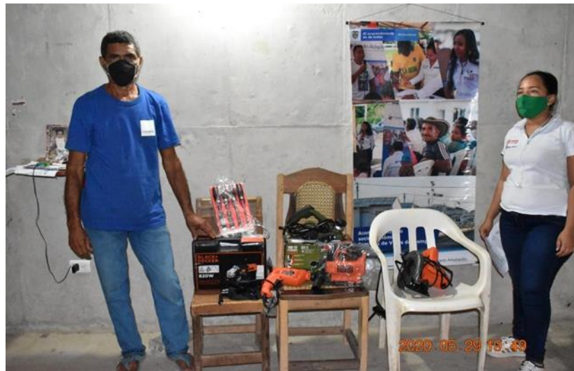
Bienes e insumos entregados para iniciativas de generación de ingresos