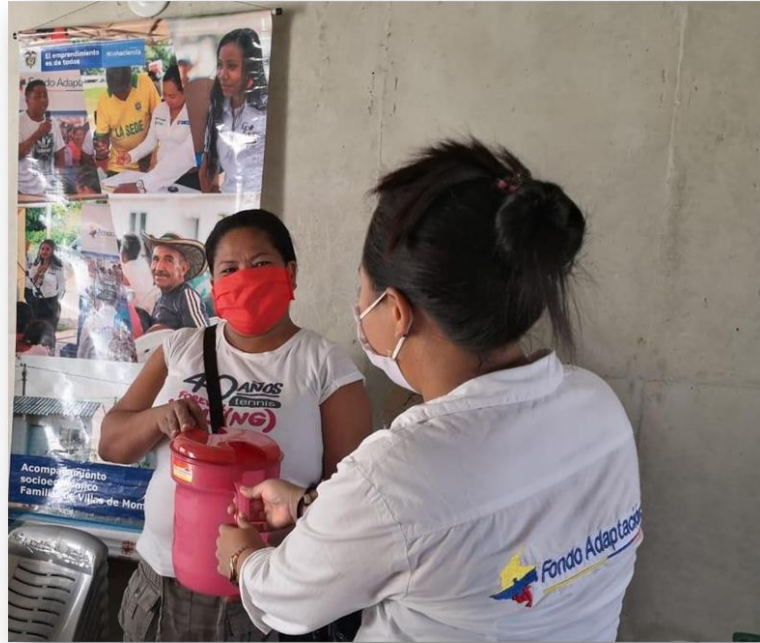
Villas de Mompox, Acompañamiento con proyectos productivos en el componente de generación de ingresos