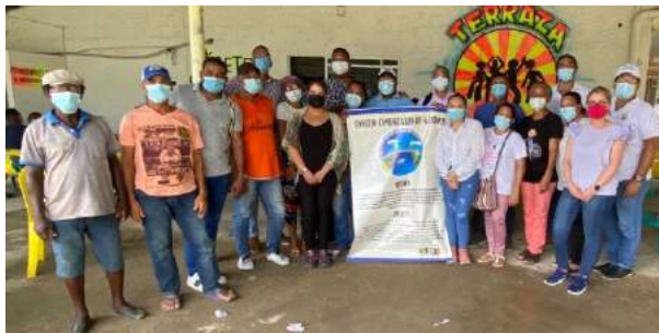
Reunión de acuerdo de medidas de compensación entre el CCCNG y el Fondo.