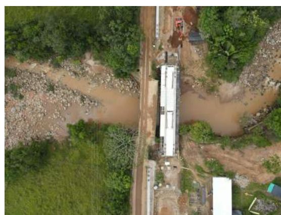
Vista aérea construcción