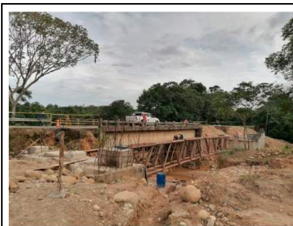
Punto fijo de foto control, 12/07/2021