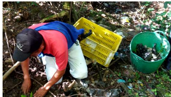
Municipio de Mercaderes, Cauca - Corregimiento La Arboleda Reforestación de nacimientos de agua

La pandemia y el aislamiento preventivo, fue un reto que el sector transformó en oportunidad y llevó a que, gran parte de los beneficiarios de los proyectos se familiarizaran y apropiaran de las tecnologías de la información y las comunicaciones, siendo esta la única manera segura para continuar con la formación y el fortalecimiento y en general la ejecución del proyecto.