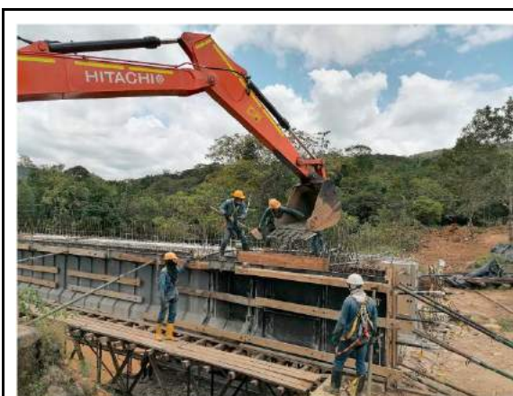
Fundida de viga 3, 27/08/2021