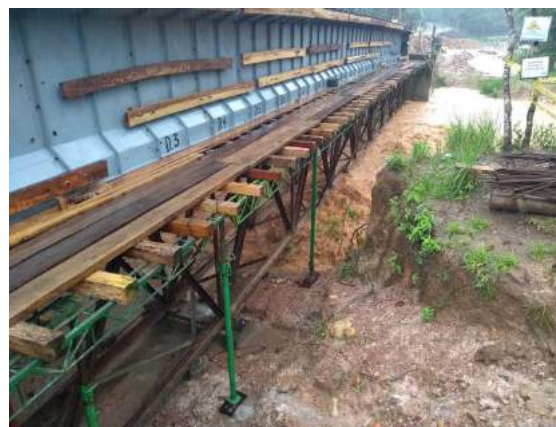
Creciente 19/08/2021, confirmación de gálibo