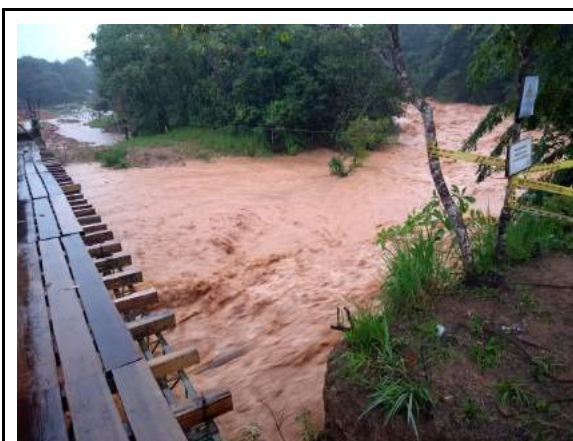
Creciente por lluvias del 18/08/21