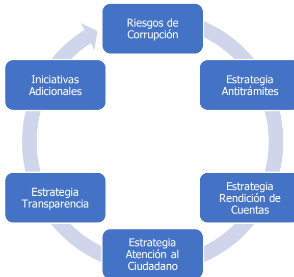
Ilustración 1: Componentes del Plan Anticorrupción y de Atención al Ciudadano

Es importante mencionar que aunque el Plan Anticorrupción y de Atención al Ciudadano tiene seis componentes, al Fondo Adaptación el componente llamado "Estrategia Antitrámites" no le aplica, debido a que la Entidad no gestiona trámites y/o servicios según la resolución 3564 de 2015 en su numeral 9.1. Trámites y servicios. En consecuencia, en este componente del Plan Anticorrupción no se formularon acciones.