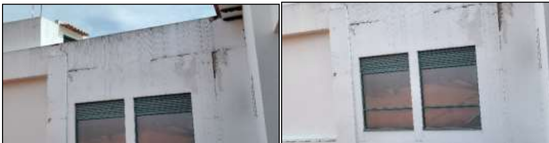
Figuras 07 y 08: Vista Costado Sur en daño eje 6-E2 hasta 13-E2