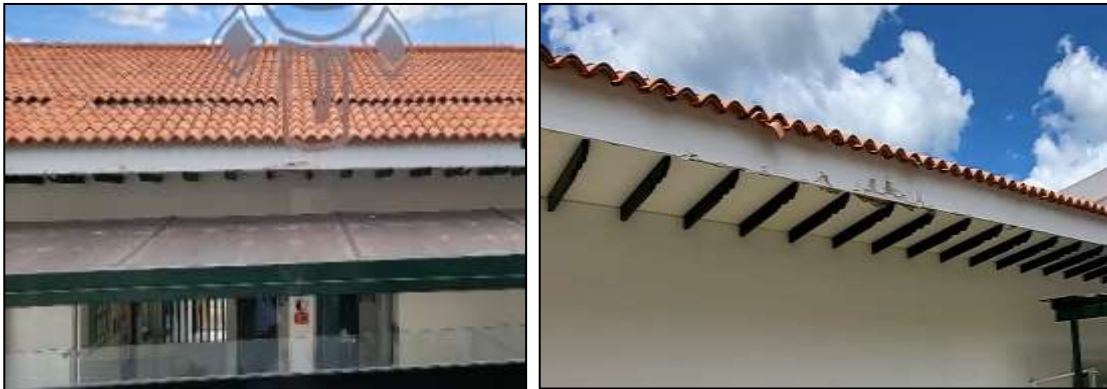
Figuras 09 y 10: Vista Daño en aleros