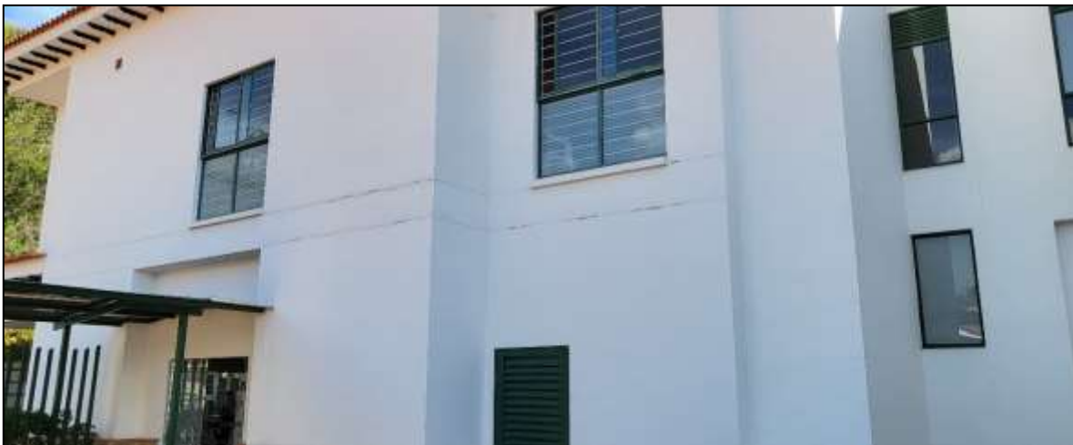
Figuras 05 y 06: Vista Costado Norte en daño eje 6-H hasta 4-H