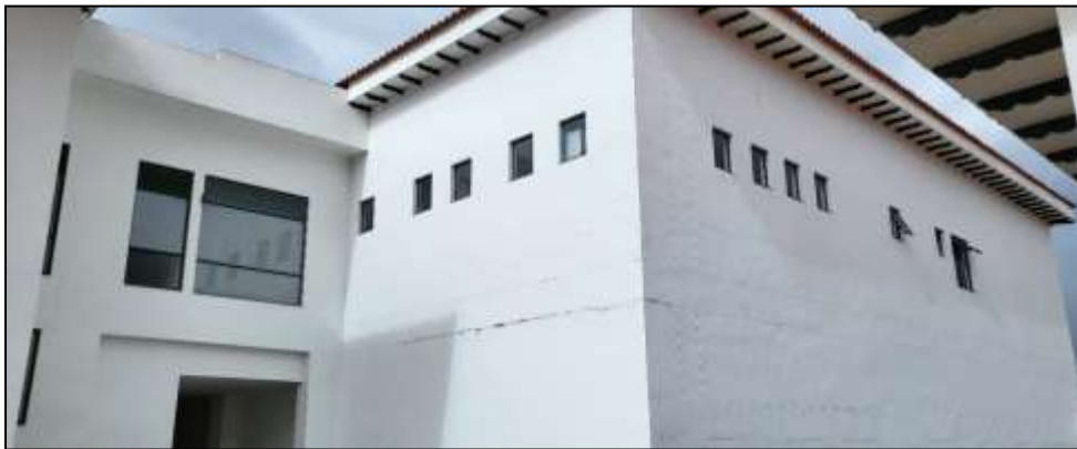
Figura 02: Vista Costado Norte en daño ejes 9-H1 hasta 15'-H1, 9-H1 hasta 9-G1, 9-G1 hasta 6-G1, 6-G1 hasta 6-H

Los sitios en donde son más evidentes las fisuras son en el exterior de la edificación sobre los ejes fachada norte 9-H1 hasta 15'-H1, 9-H1 hasta 9-G1, 9-G1 hasta 6-G1, 6-G1 hasta 6-H, 6-H hasta 4-H y en el costado sur eje 6-E2 15 hasta 13-E2; estas fallas se presentan en diferentes anchos y orientaciones que han aumentado en el tiempo de acuerdo con lo informado por el personal de la ESE, por lo cual han realizado requerimientos por parte de la Gerencia del Hospital, y reparaciones de la firma contratista que no han sido eficientes, pues el daño persiste.