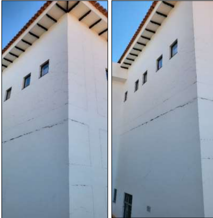
Figuras 03 y 04: Vista Costado Norte en daño eje 9-H1 hasta 9-G1