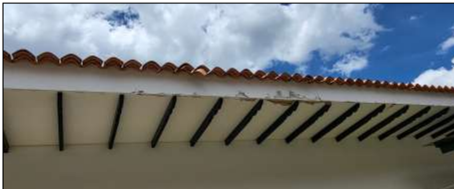
Figura 11: Vista Daño en aleros

Esta actividad fue liquidada mediante tres ítems iguales, uno para cada bloque intervenido.