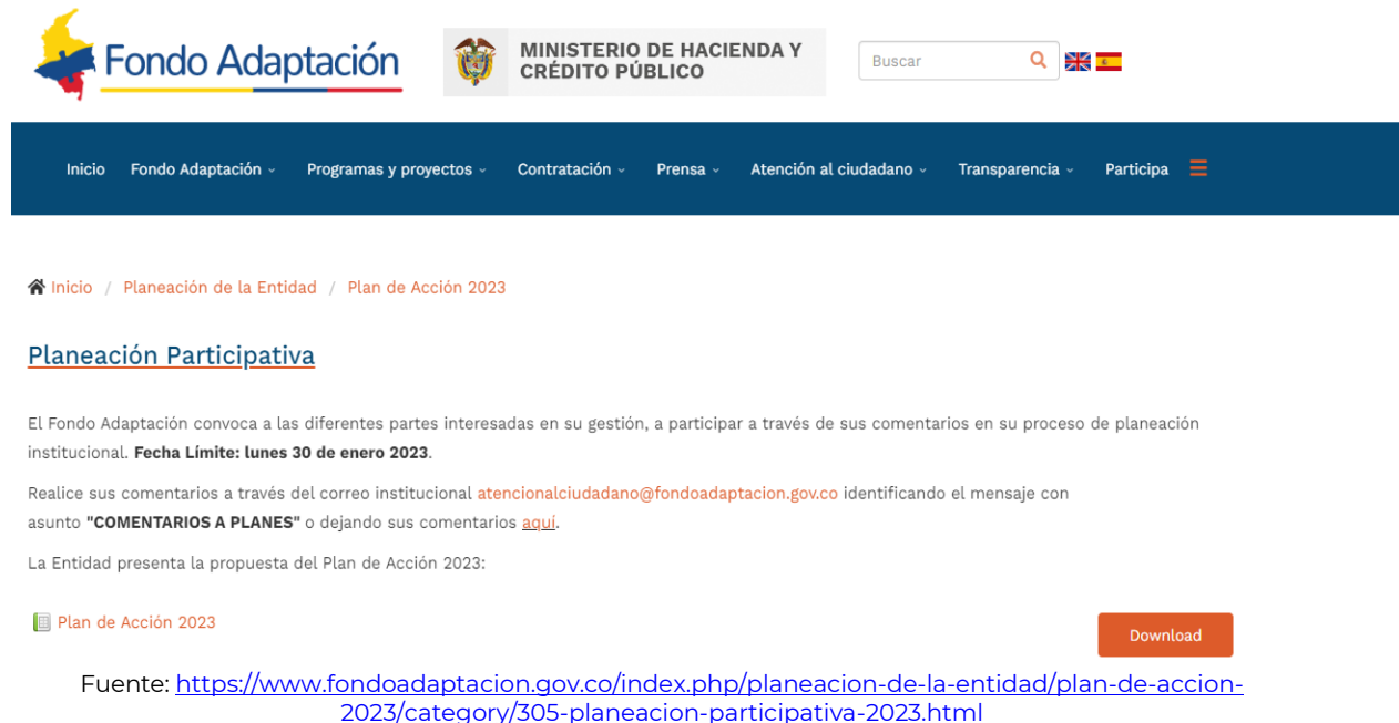
Imagen 1. Publicación de la Propuesta de Plan de Acción en la Página Web de la Entidad

De conformidad con el Decreto 124 del 26 de enero del año 2016, el Fondo formuló y publicó oportunamente, dentro del primer trimestre del presente año, el Plan a ejecutar en la presente vigencia. A partir del 25 de enero de 2023 se puso a consideración de los diferentes públicos de interés el plan de acción 2023, dentro del cual se encontraba el Plan Anticorrupción y de Atención al ciudadano para la vigencia actual. Se dio como plazo para presentar observaciones o sugerencias, hasta el 30 de enero de 2023, según se muestra en las siguientes imágenes: