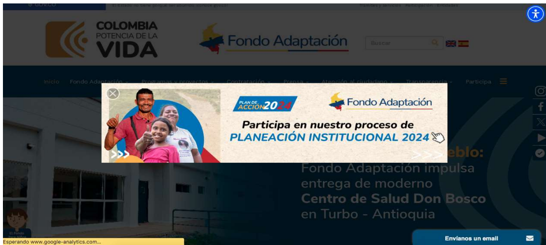
Ventana PopUp al ingresar al sitio web