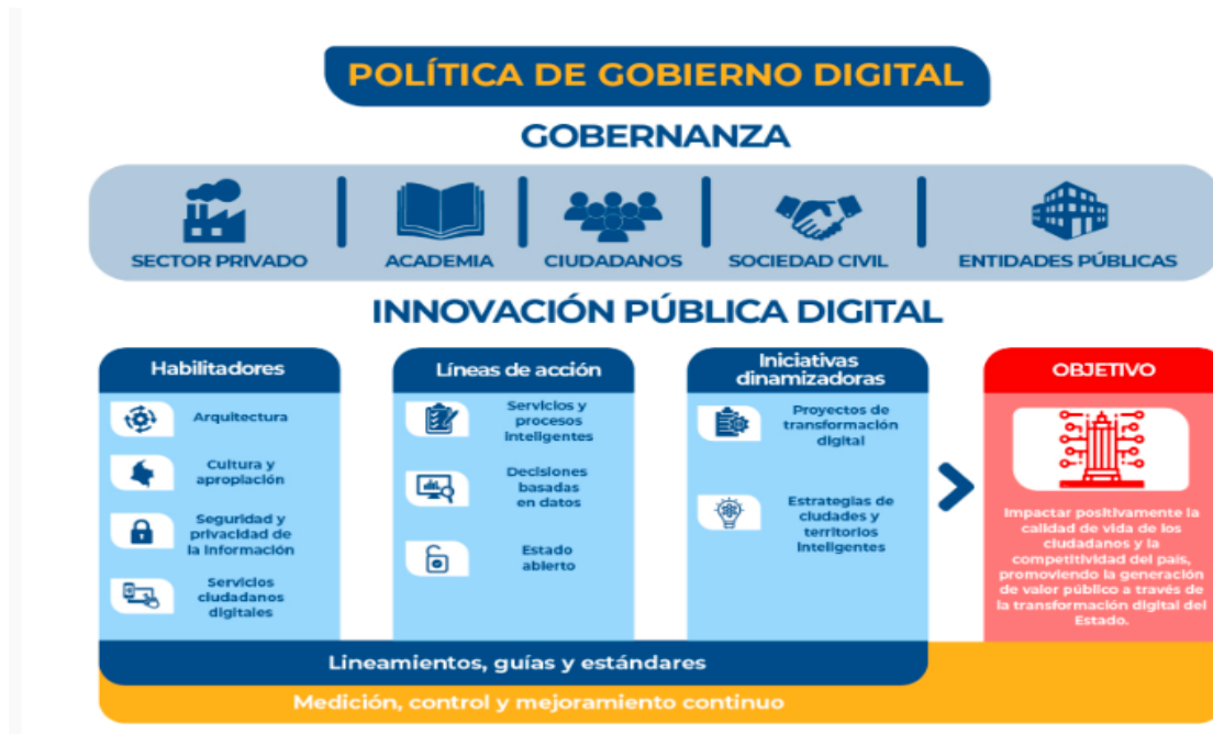
Ilustración 3. Elementos que componen la estructura de la política- MINTIC

De acuerdo con lo establecido por MINTIC, el objetivo de cada uno de los elementos es: