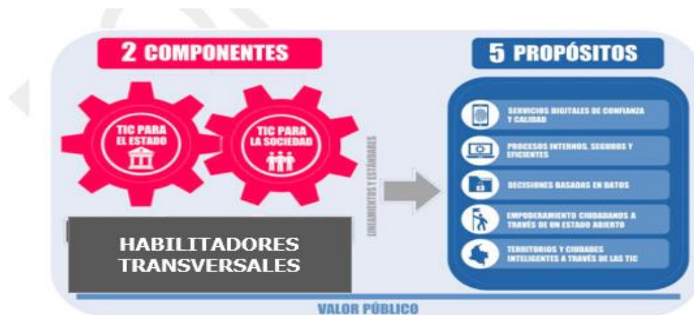
Ilustración 2 Componentes de la Política Gobierno Digital MinTIC

La política de gobierno digital tiene dos componentes fundamentales, habilitadores transversales los cuales conllevan a cumplir 5 propósitos, como se ilustra a continuación.