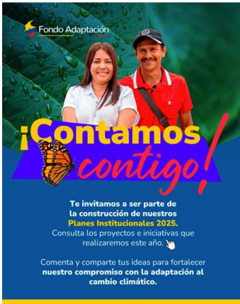
Banner de difusión interna