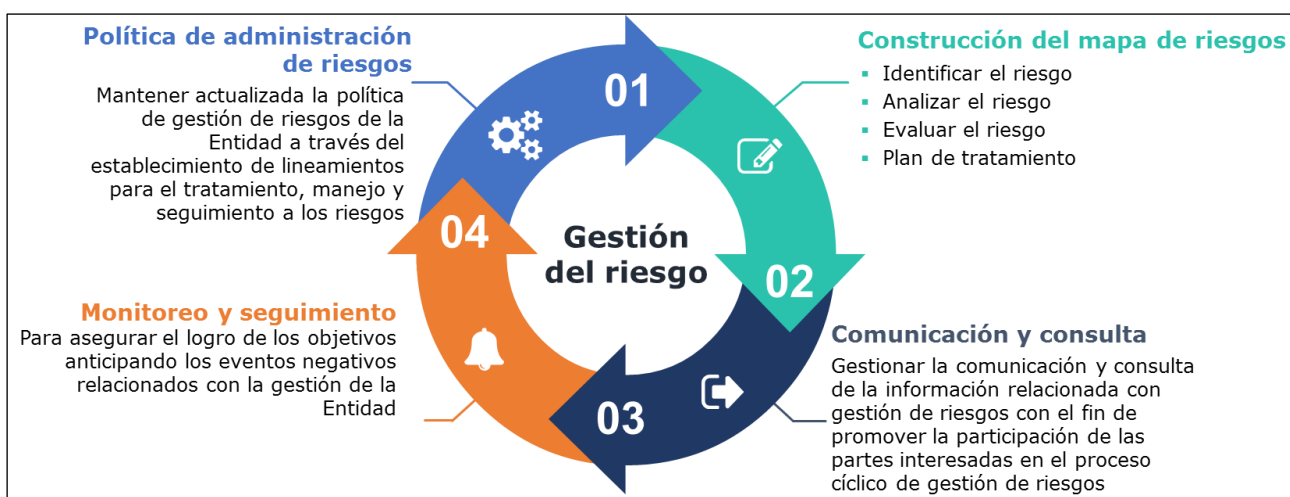
Ilustración 2: Fases de la Gestión del Riesgo

En la fase de identificación se establece las fuentes o factores de riesgo, las causas del riesgo con base en el análisis de contexto del Fondo Adaptación y del proceso, que pueden afectar el logro de los objetivos de los procesos y los institucionales; en el caso de riesgos de corrupción se gestionan todos los riesgos.