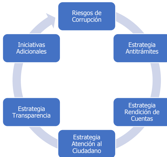
Ilustración 1: Componentes del Plan Anticorrupción y de Atención al Ciudadano

Es importante mencionar que aunque el Plan Anticorrupción y de Atención al Ciudadano tiene seis componentes, al Fondo Adaptación el componente llamado “Estrategia Antitrámites” no le aplica, debido a que la Entidad no gestiona trámites y/o servicios según la resolución 3564 de 2015 en su numeral 9.1. Trámites y servicios. En consecuencia, en este componente del Plan Anticorrupción no se formularon acciones.